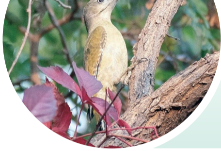
▲葱葱郁郁的徂徕山林场。 ▲灰头绿啄木鸟。