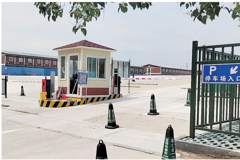
新停车场可停放车辆551辆。

本报7月8日讯(记者 崔东旭)近期,有市民反映高铁泰安站客流量大,接送站车辆多,部分车辆长时间占用送站车道,造成交通不便。对此,市公安局交警支队岱西大队加大巡查力度,开展为期1个月的车站周边交通秩序整治行动,集中清理长时间滞留、不规范停放车辆。