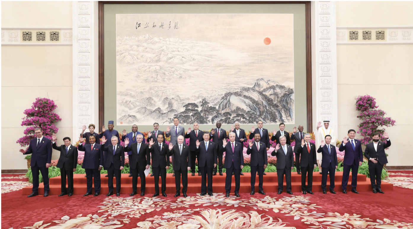
■10月18日上午,国家主席习近平在北京人民大会堂出席第三届“一带一路”国际合作高峰论坛开幕式并发表题为《建设开放包容、互联互通、共同发展的世界》的主旨演讲。