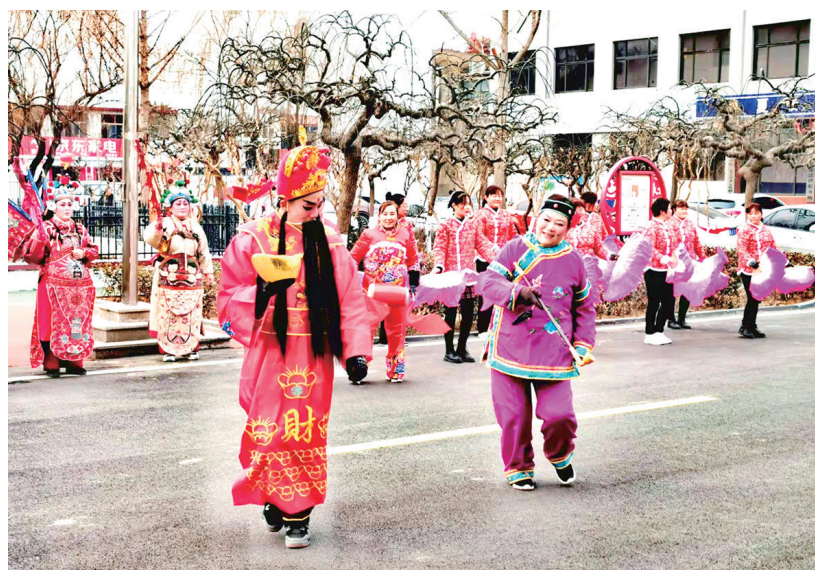
■夏张镇大西牛村故事队拜年活动。

的村(社区)充分利用传统节日,采取自我组织、联结互动等方式自办活动,新春文艺汇演、农家书屋读书会、和美邻里节等群众性文化活动蓬勃开展,在丰富全区群众精神文化生活的同时,有效提升了群众文化生活满意度。