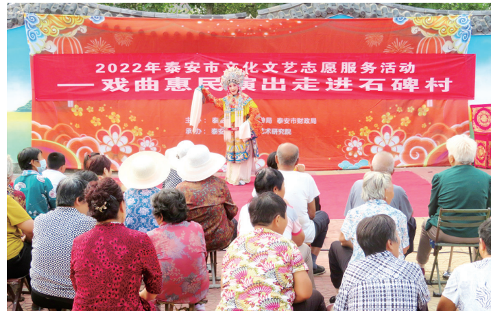
■演出现场。

本报9月20日讯(最泰安安全媒体记者 张芮)近日,市山东梆子艺术研究院按照市文化和旅游局统一部署,组织精干演出队伍来到泰山区邱家店镇石碑村,开展2022年泰安市文化文艺志愿服务活动,演出受到群众热烈欢迎。