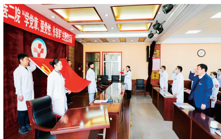
■重温入党誓词。

本方式、统一经办流程、统一办理时限、统一服务标准的“六统一”要求，积极推进医保经办业务“网上办”“掌上办”，实现高频服务事项全省通办、跨省通办，做到窗口服务“一窗受理、一次办好”，为参保群众提供优质的医保经办服务。