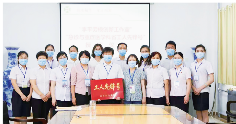
■急诊与重症医学科获省工人先锋号。