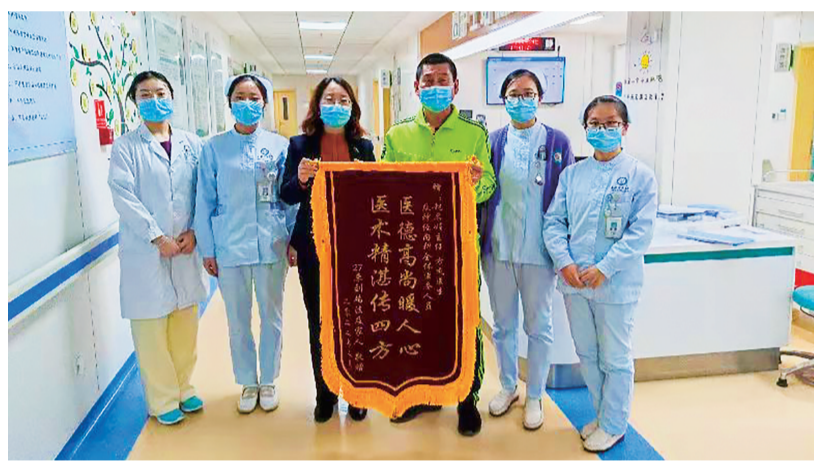
■患者家属为医护人员送锦旗。