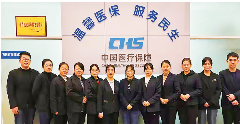
■医保窗口团队。

市医保局将利用好此次契机，持续完善提高医保窗口标准化服务水平，以实际行动擦亮医保经办服务品牌。