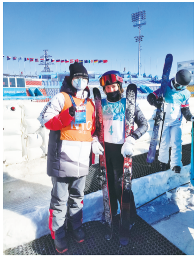
■与谷爱凌合影。

前往比赛场地实行通行管控。张腾介绍:“当时的室外温度在零下11℃左右,赛时执裁最久的一次,一天站立近6小时,中午的休息时间比较紧张,我们一般就在场地吃盒饭,如果有剩余时间,就在板凳上眯一会儿。”