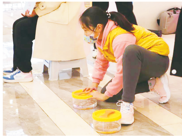
■模拟冰壶闯关活动。

本报2月18日讯(最泰安安全媒体记者 池彦明)近日,共青团新泰市委举办“牵手希望·助力冬奥”志愿陪伴活动,30余名受助儿童在志愿者的陪伴下用自己的方式观冬奥、乐冬奥、点亮冬奥。