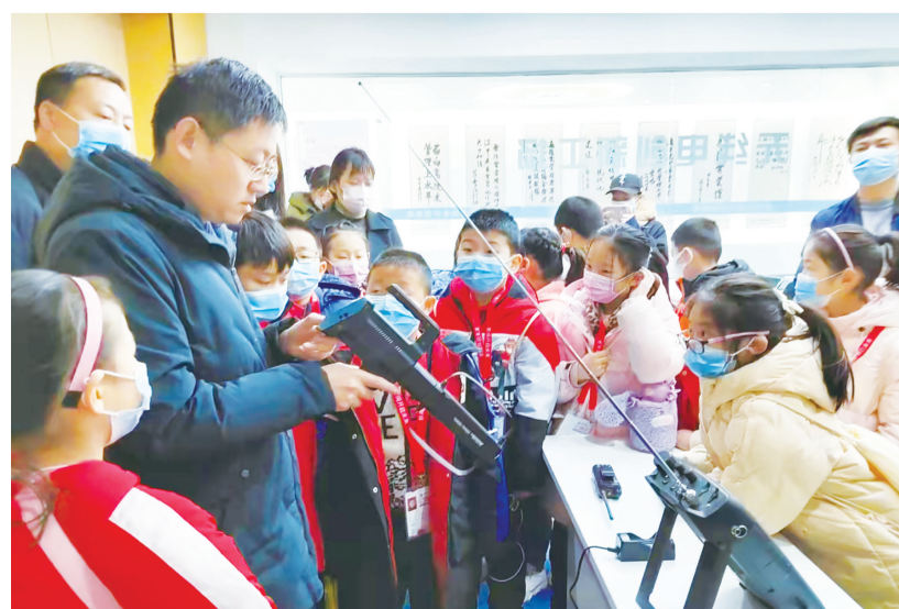
工作人员向小记者介绍无线电设备。

本报2月14日讯(最泰安全媒体记者 李皓若)13日是“世界无线电日”,为向社会公众科普无线电技术知识,鼓励社会各界理解、支持无线电管理工作,近日,市工业和信息化局联合市业余无线电协会在泰安无线电科普基地开展了“世界无线电日”科普体验活动,我市部分无线电爱好者、小记者参加了活动。