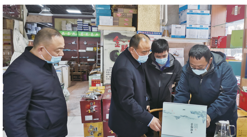
东平市场监管局执法大队开展检查。

本报12月21日讯(通讯员孟宪鲲)21日,东平市场监管局执法大队查处一批仿冒“地理标志”产品的侵权案件,这是该局部署知识产权执法护佳节行动的初步成果。 东平市场监管局部署开展知识产权执法护佳节行动,加强对驰名商标、老字号商标、企业专利、地理标志产品的保护。针对食品、化妆品、农资、汽车配件、家用电器、装饰装修材料、服装、家具等重点商品开展检查,聚焦食品药品、家用电器、日用品、环保产品、电子信息产品等重点产品开展专利保护。还将加强电子商务领域执法,建立线上排查、源头追溯、协同查处机制,推进线上线下一体化执 法。同时,重视消费者权益保护工作,针对案件多发和举报投诉较多的商品交易市场,组织开展集中整治,严厉打击侵权行为,督促市场主办方切实负起市场管理责任,引导经营者增强知识产权保护意识,自觉遵守诚信经营。加强与公安系统的协作,强化对重大违法行为的刑事责任追究。 自该局部署行动以来,查处知识产权侵权案件56件,查处仿冒“耐克”“阿迪达斯”“李宁”等名牌鞋帽的产品一大批,查处仿冒“方正大米”“五常大米”“龙口粉丝”地理标志农产品的违法产品7批次,查处仿冒“好太太”“太太乐”“汾酒”“海之蓝”等知名产品的产品20箱,有力维护群众消费安全。