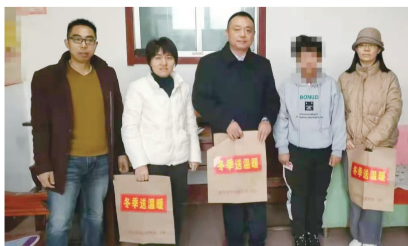
为单亲家庭儿童送温暖。

本报12月21日讯(通讯员王璐)近日,天气转寒,宁阳县东疏镇计生协会的会员们又惦记起了那些单亲家庭的孩子,他们带着孩子们的心愿与满满的爱心,走进一户又一户单亲儿童家中,在这个寒冷的冬天,为孩子们送去温暖。 走进孩子们家中,孩子们见到熟悉的叔叔阿姨们非常高兴,都开心地讲述着自己最近的学习或成长情况。计生协会的会员们也一再叮嘱他们好好学习,有困难就和村里或叔叔阿姨说。此次暖冬活动,东疏镇拿出专项资金对18名家庭十分困难的单亲家庭孩子进行了资助,为他们分别购买了价值300元的衣服、鞋等,同时,为