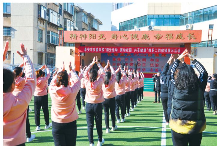
活动现场。

本报12月6日讯(通讯员 李梁)欢快的脚步踏着节拍,跳动的音符在晴空下飞扬。为丰富广大教职工业余文化生活,构建文明、健康、团结、和谐的校园,近日,泰安市实验学校举办了“阳光运动、舞动校园、共享健康”教职工韵律操展示活动。