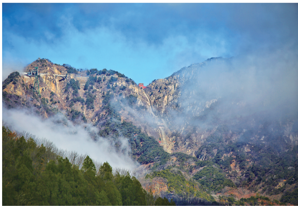
极目远眺泰山风光。