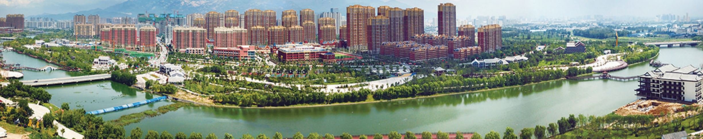
蓝天白云,秀美泰安。

行走在泰安,抬头望去,是蓝天白云;举目远眺,是苍翠青山;驻足垂眸,是清水潺潺;竖耳聆听,是天籁之音。山清水秀岸绿景美,已经成为泰安的真实写照。