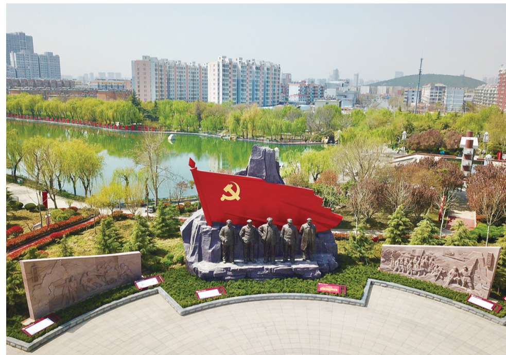
南湖党建文化主题公园风景如画。