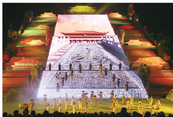
《中华泰山·封禅大典》大型实景演出。