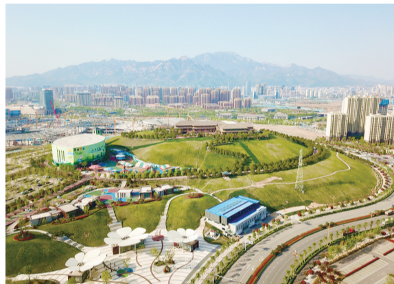
刘家山山顶的泰山精酿啤酒坊预计“五一”期间投入试运营。