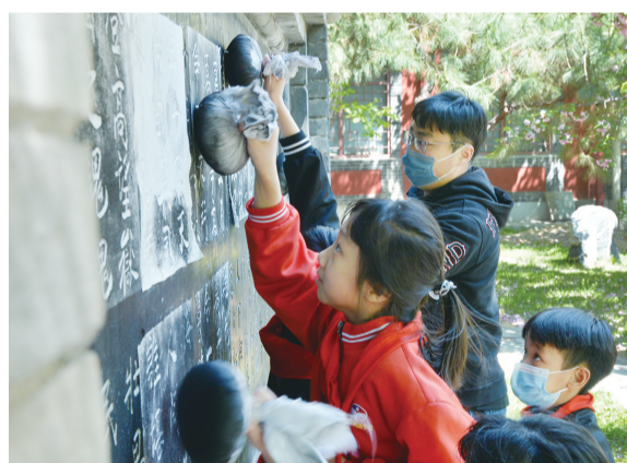
小记者走进岱庙感悟千年泰山文化。